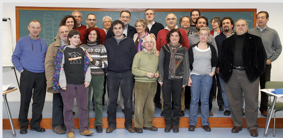
Encuentro de Comisiones de Evaluación. Universidad de Deusto Diciembre 2010

Las sesiones comenzaron con una presentación del sistema de adecuación ética del proyecto Fiare, seguida de un debate entre todos los asistentes sobre los retos que afronta dicho sistema en estos momentos. Posteriormente, se desarrollaron sesiones de trabajo en grupo y debate en plenario sobre cada uno de los aspectos específicos de la evaluación ético social de las solicitudes de financiación: estructuras,