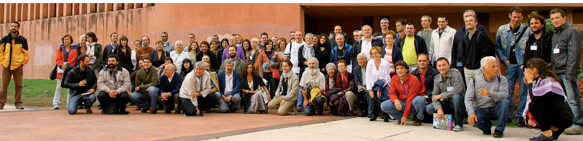
Reunión grupos locales, Durango septiembre de 2010.

bilidad de comprometerse como socio futuro de la cooperativa de crédito en que la actual agencia pueda desembocar 1 .