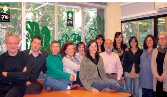
Equipo de Arç

En setiembre de 2010 se ha establecido un convenio de colaboración entre Fiare y Arç Corredoria d'Assegurances S.Coop.C.L. con el objeto de impulsar el desarrollo del seguro ético y solidario y la construcción de mercado social.